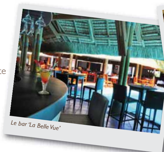
Le bar 'La Belle Vue'