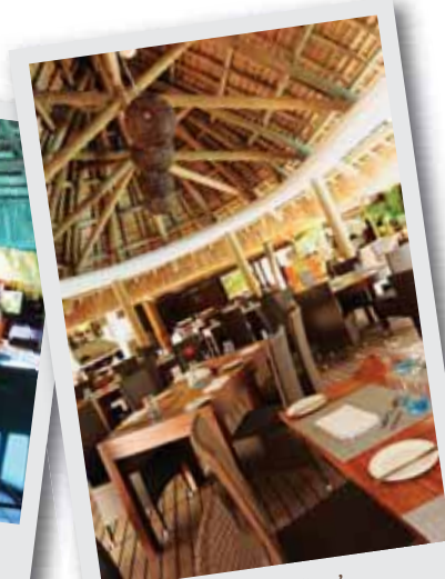
Le restaurant 'La Paillote'