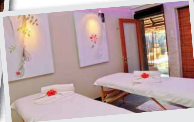
L'une des trois salles de massage