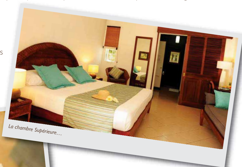
La chambre Supérieure...