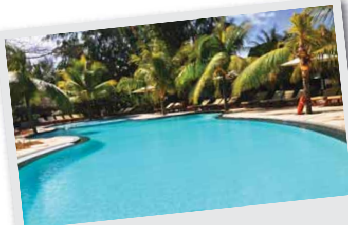
La nouvelle piscine