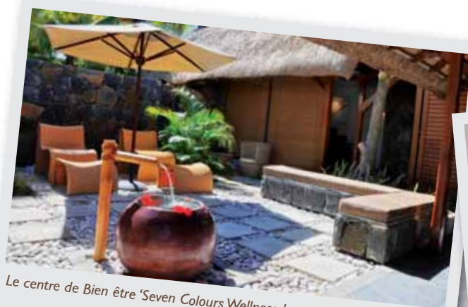
Le centre de Bien être 'Seven Colours Wellness Lounge'