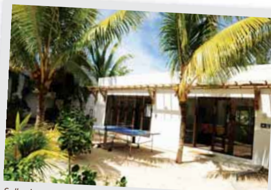
Salle de gym et de jeux